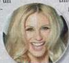
Michelle Hunziker, 36

del sole. Teme, infatti, di poter ripetere in qualche modo degli errori già commessi in passato. Dopo un'amicizia speciale, l'amore tra loro sta nascendo, anche se per il momento continuano a vedersi di nascosto. Lui non è un volto noto del mondo dello spettacolo, non è