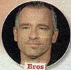
Eros Ramazzotti, 49

Roma. Soddisfazioni lavorative per Emma Marrone (28 anni, a lato) direttore artistico dei Blu al serale di Amici 12 . La cantante salentina si dichiara single ma, secondo la nota medium Elisa (sopra), la quale ha accettato per Top una piccola indagine sulle coppie vip, avrebbe una relazione amorosa che, ad oggi, preferirebbe tenere ben nascosta.